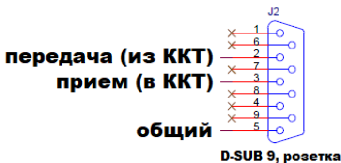
Рисунок 1. Цоколевка разъема обмена данными с хостом.

Передача данных может осуществляться либо по последовательному интерфейсу RS232, либо через Ethernet (см. 1.5). При передаче через последовательный интерфейс RS232 линии управления потоком не используются. Используются только линии приема данных (Rx) и передачи данных (Tx). Интерфейс является гальванически изолированным от всех остальных цепей ККТ (включая источник питания). Для подключения хоста используется разъем J2 ККТ (розетка DB-9). На одну шину RS232 может быть подключен только один хост и один ККТ. Разъем имеет следующую цоколевку: